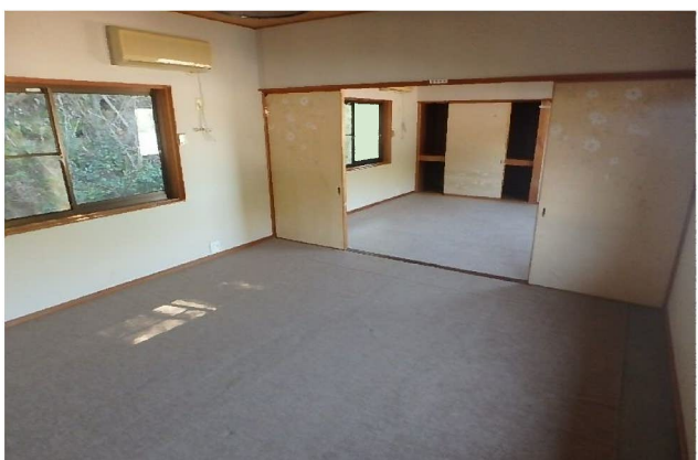
( 2階 和室 )