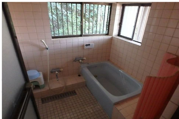
( お 風 呂 )