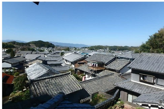
( 物件からの風景 )