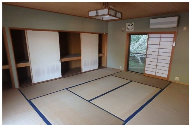
( 1階 和室 )