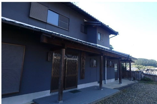
( 外 観 )