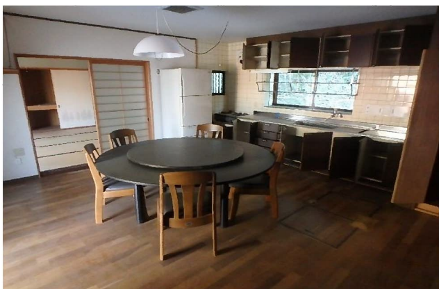
( ダイニングキッチン )