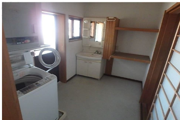
( 洗面所・脱衣所 )