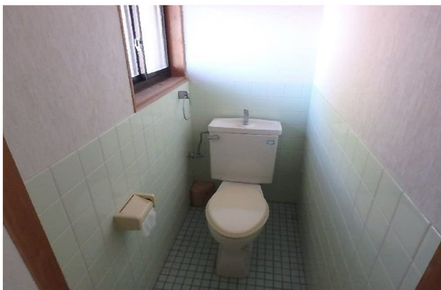
( ト イ レ )